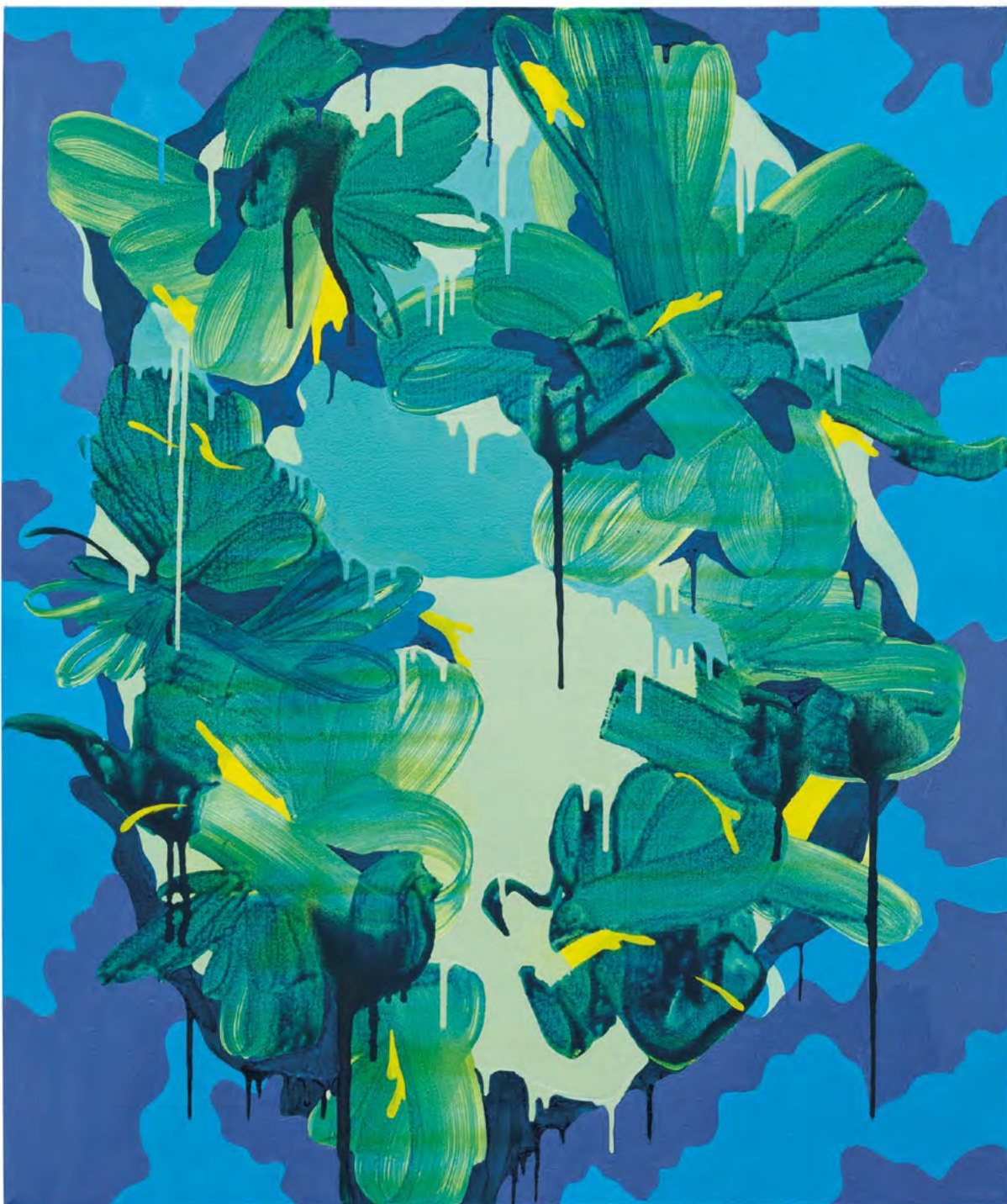
Shape Shifter, öljy, akryyli ja muste kankaalle, 2015

"Teos muuttui kokonaan työn edetessä, erilaiset vaiheet seurasivat alkumaalausta. Värit ja värikuullotukset tulivat keskeiseksi osaksi lopputulosta."