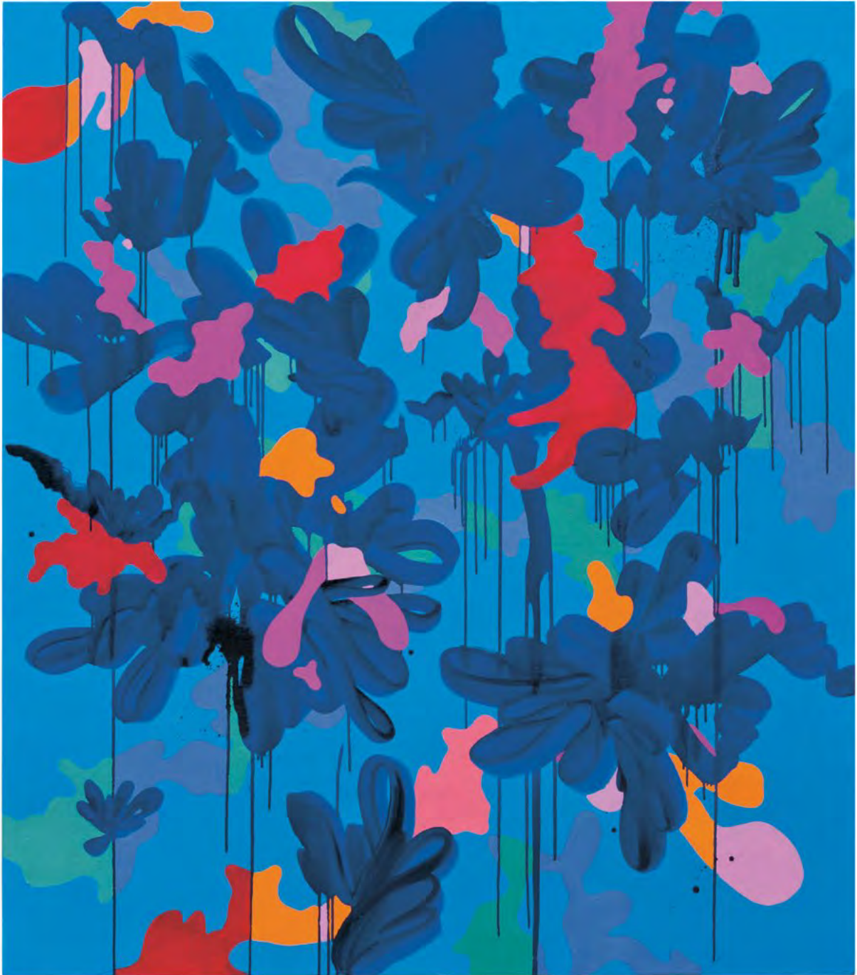
Lucid, öljy kankaalle, 2015

"Nimi tarkoittaa kirkasta, kuulasta. Tätä tehdessäni en epäroinyt hetkeäkään, tiesin, mitkä värit haluan laittaa ja työ valmistui täysin spontaanisti."