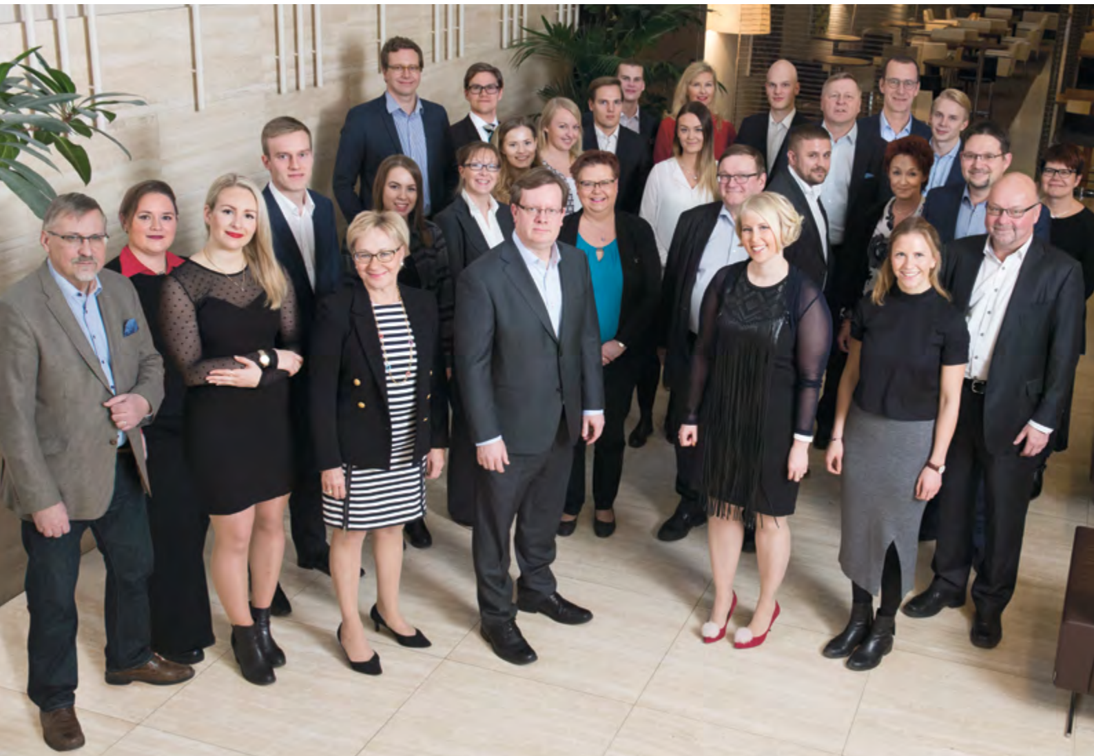
Henkilöstömme joulukuussa 2016.